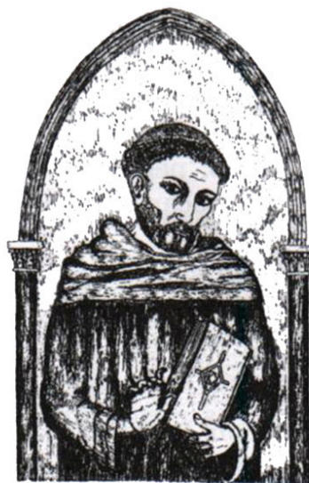
Fra Salimbene da Parma

La città di Vignola, famosa per la sua ricca storia e tradizione culturale, ha un legame profondo con il gioco degli scacchi. Durante il XIII secolo, Federico II, Imperatore del Sacro Romano Impero, giocava a scacchi mentre tramava contro i suoi rivali, come raccontato dal cronista Fra Salimbene da Parma. Federico, famoso per le sue campagne militari e il suo astio verso il papato, utilizzava gli scacchi non solo come passatempo, ma anche come strumento di riflessione strategica.